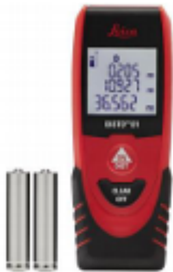
Leica DISTO™ D 1 Art. No. 843418

? Leica DISTO™ D1 laser distance meter ? Batteries